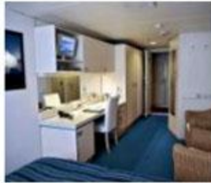
■シングル(パーシャルビュー)