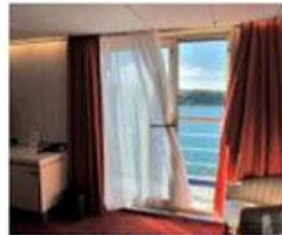
■バルコニースイート