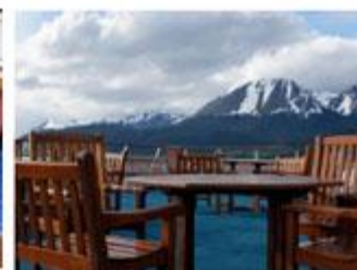
Observation Deck オブザーベーションデッキ