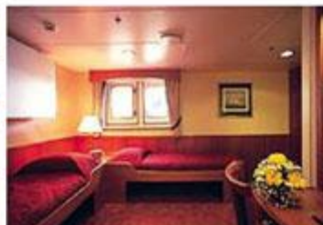
Superior Twin スーベリア・ツイン