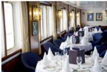
Dining room ダイニングルーム