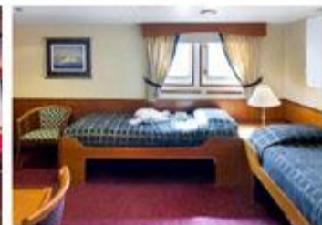
Deluxe Twin デラックス・ツイン