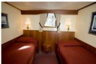
Main deck Twin メインデッキ・ツイン